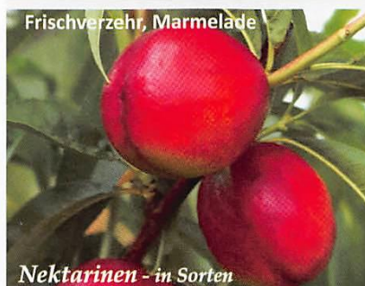
Frischverzehr, Marmelade Nektarinen - in Sorten