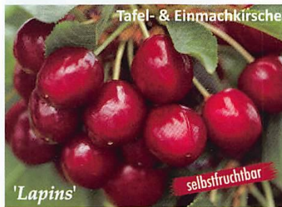
Tafel- & Einmachkirsche 'Lapins' selbstfruchtbar

Knopekirschen zeichnen sich durch ein festes, helles Fruchtfleisch aus und sind daher in der Regel platzfester als Herzkirschen mit ihrem weichen, saftigen und zumeist roten Fruchtfleisch.