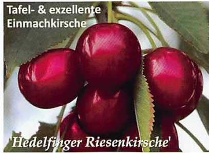
Tafel- & exzellente Einmachkirsche 'Hedelfinger Riesenkirsche'