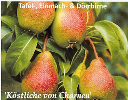
'Köstliche von Charneu'