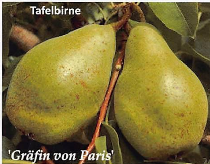
'Gräfin von Paris'