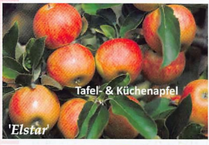
Tafel- & Küchenapfel 'Elstar'