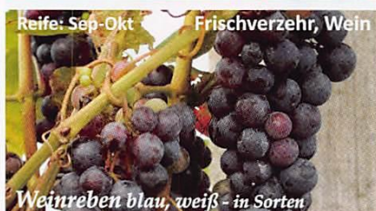
Reife: Sep-Okt Frischverzehr, Wein