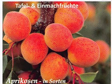
Tafel- & Einmachfrüchte Aprikosen - in Sorten