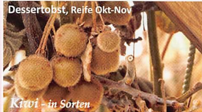
Dessertobst, Reife Okt-Nov