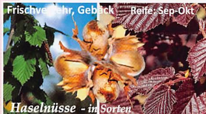
Frischverzehr, Gebäck Reife: Sep-Okt