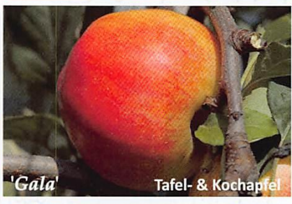
'Gala' Tafel- & Kochapfel