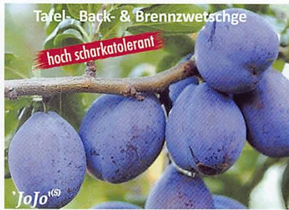
Tafel-, Back- & Brennzwetschge