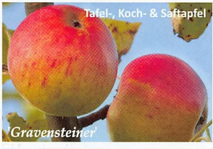
Tafel-, Koch- & Saftapfel 'Gravensteiner'