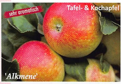
sehr aromatisch Tafel- & Kochapfel 'Alkmene'