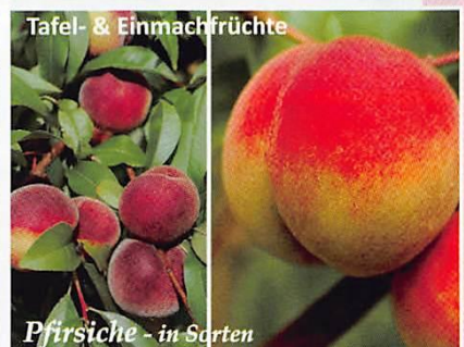
Tafel- & Einmachfrüchte Pfirsiche - in Sorten