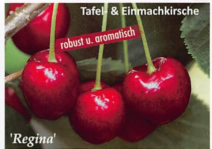
Tafel- & Einmachkirsche 'Regina' robust u. aromatisch