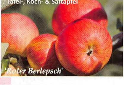
Tafel-, Koch- & Saftapfel 'Roter Berlepsch'