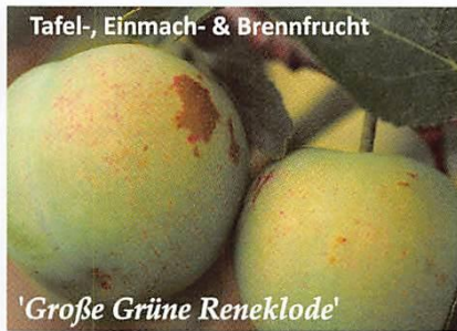
Tafel-, Einmach- & Brennfrucht