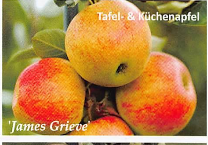
Tafel- & Küchenapfel 'James Grieve'