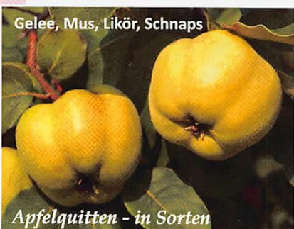
Apfelquitzen - in Sorten