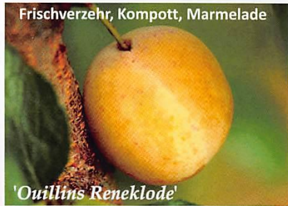
Frischverzehr, Kompott, Marmelade