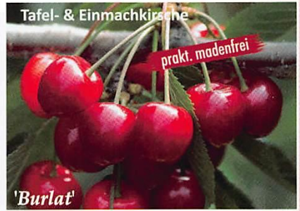
Tafel- & Einmachkirsche 'Burlat' prakt. madenfrei