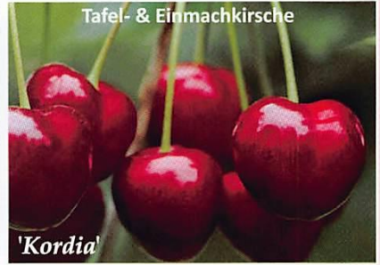
Tafel- & Einmachkirsche 'Kordia'