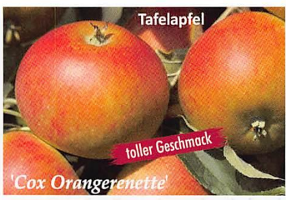
Tafelapfel toller Geschmack 'Cox Orangerenette'