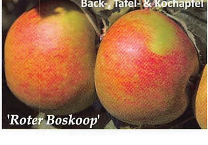
Back-, Tafel- & Kochapfel 'Roter Boskoop'

'Alkmene' · Herbstapfel, GR: Sep-Nov Mittelgroßer, grüngelber, knackig-fester Apfel mit appetitlicher, karminroter Backe. Süß-zartsäuerlich und aromatisch. Für Hausgarten und Obstwiese. Sehr robust!