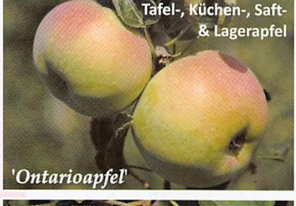
Tafel-, Küchen-, Saft- & Lagerapfel 'Ontarioapfel'