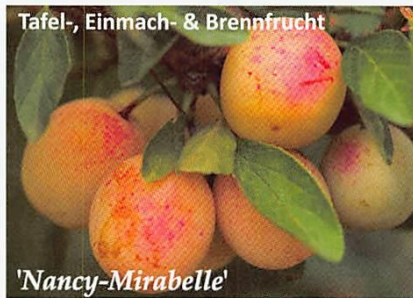
Tafel-, Einmach- & Brennfrucht