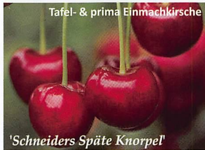
Tafel- & prima Einmachkirsche 'Schneiders Späte Knorpel'