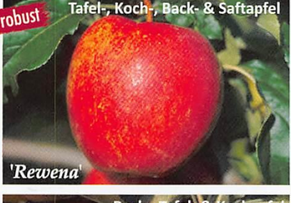
sehr robust Tafel-, Koch-, Back- & Saftapfel 'Rewena'