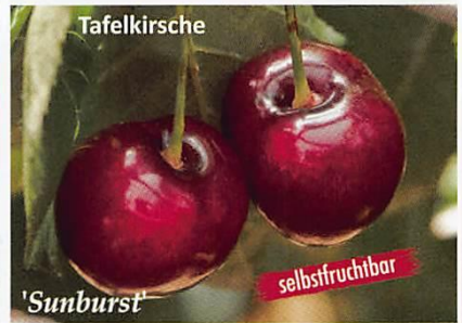
Tafelkirsche 'Sunburst' selbstfruchtbar