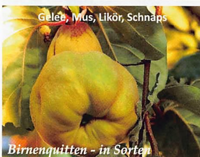
Birnenquitzen - in Sorten