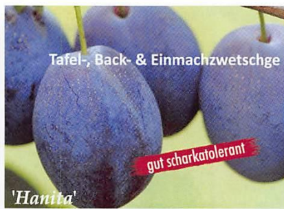
Tafel-, Back- & Einmachzwetschge