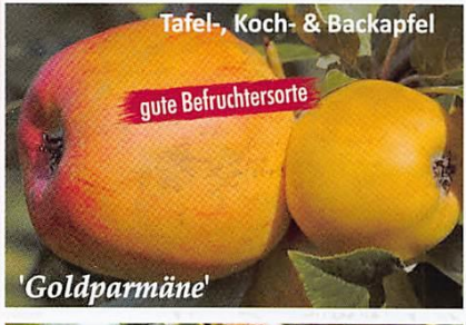
Tafel-, Koch- & Backapfel gute Befruchtersorte 'Goldparmäne'