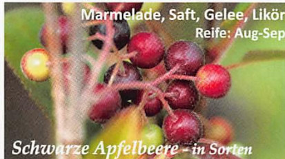
Marmelade, Saft, Gelee, Likör Reife: Aug-Sep