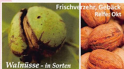
Frischverzehr, Gebäck Reife: Okt