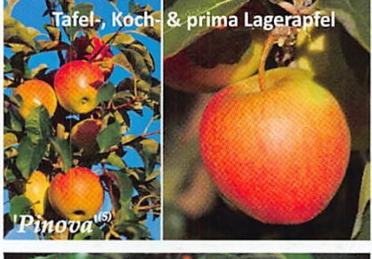
Tafel-, Koch- & prima Lagerapfel 'Pinova' (GR)