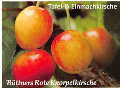
Tafel- & Einmachkirsche 'Büttners Rote Knorpelkirsche'

Selbstfruchtbar Knopekirsche mit schlank-aufrechtem Wuchs, daher auch als Säulenkirsche lieferbar. Die sehr großen, hell gesprenkelten Kirschen schmecken süß-feinsäuerlich. Für Hausgarten und Obstwiese.