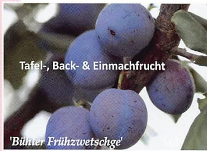
Tafel-, Back- & Einmachfrucht