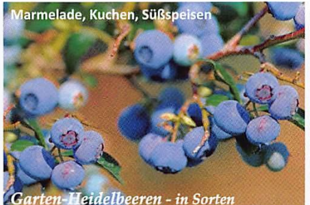
Marmelade, Kuchen, Süßspeisen

Bei entsprechender Sortenwahl reicht die Erntezeit von Ende Jun bis Anfang Sept. Deshalb am besten 2-3 Sorten in ein besonntes Moorbeet nebeneinander pflanzen.