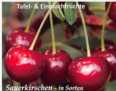
Tafel- & Einmachfrüchte Sauerkirschen - in Sorten

Pfirsiche: Von Jul bis Sept reifen die süß-aromatischen, feinsäuerlichen Früchte mit flaumiger Schale. Zwischenzeitlich gibt es robuste Sorten, denen die Kräuselkrankheit wenig anhaben kann. Wir beraten Sie gerne!