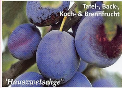
Tafel-, Back-, Koch- & Brennfrucht