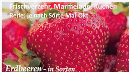
Frischverzehr, Marmelade, Kuchen Reife: je nach Sorte Mai-Okt