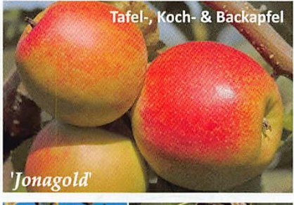
Tafel-, Koch- & Backapfel 'Jonagold'